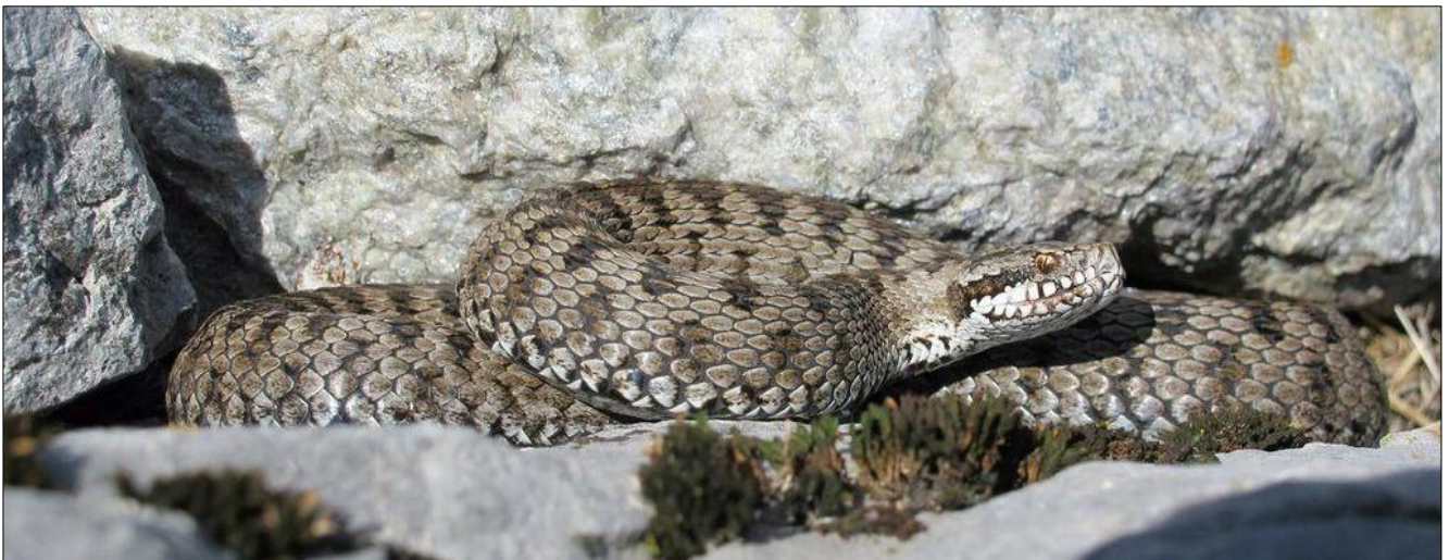
Eine Münstertaler Kreuzotter an ihrem Überwinterungsplatz

In den Theorieblöcken erhalten die Teilnehmerinnen und Teilnehmer einen Einblick in die Biologie und Artenvielfalt der einheimischen Reptilienfauna. Themen wie Körperbau und Körperfunktionen, Fortpflanzung, Jagd und Ernährung sowie weitere Verhaltensweisen werden in Wort und Bild ebenso behandelt wie die unterschiedlichsten Lebensräume, in welchen die heimischen Arten gefunden werden können.